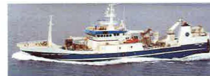
TRÓNDUR Í GØTU • FD 175