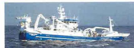
FINNUR FRÍÐI • FD 86

SP/F PROLAKK • VEGURIN LANGI • 110 TÓRSHAVN • POSTSMØGA 1393 • TLF.: 311252 • FAX: 311253